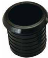
Fig. 3 1126-32BC33 BUJE LATERAL CERRADO 32 MM ALETA 33 MM

Fig. 4 1126-32BA33 BUJE LATERAL ABIERTO 32 MM ALETA 33 MM